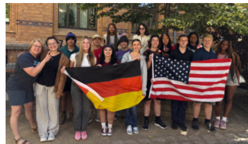
Germany for you

Austausch mit den USA? Ja, klar! Auch in politisch bewegten Zeiten schließen unsere Teilnehmenden der USA-Programme internationale Freundschaften fürs Leben. Neben dem Jahresaustausch haben wir 2025 die Programme „USA for you“ und „Germany for you“ für weitere 60 Jugendliche durchgeführt.